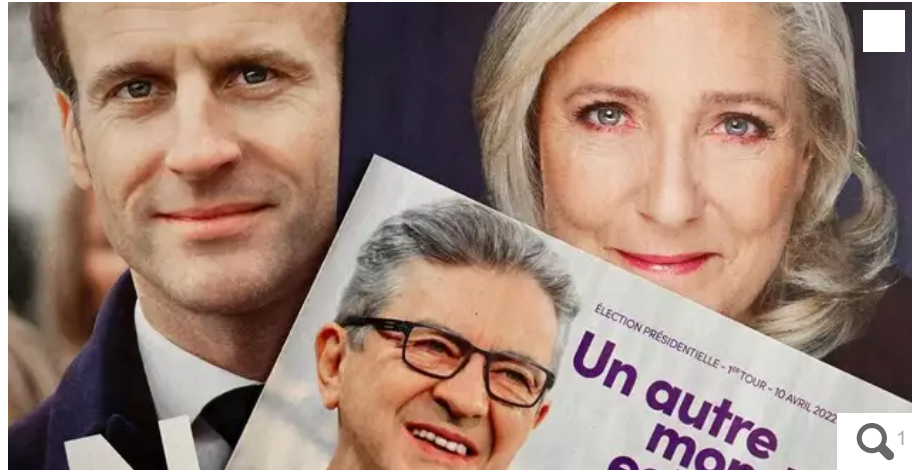
Jean-Luc Mélenchon est arrivé en tête à Nantes. Emmanuel Macron, lui, a obtenu le meilleur score dans l'ensemble du département où Marine Le Pen a recueilli 16,92 % des suffrages.

Le Président sortant arrive en tête des suffrages. Mais la surprise vient du candidat de la France insoumise qui finit deuxième dans ce département. À Nantes, il se place carrément premier.