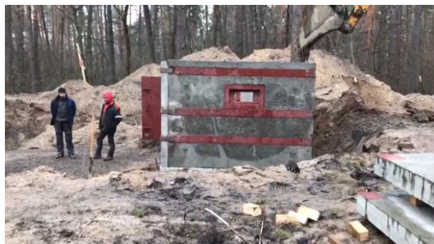
Sur la route de Kiev, le régime Azov construit une ligne de défense, constituée de bunkers, pour protéger les accès vers la capitale [Maurine Mercier - RTS]

Mais l'arrivée progressive de nouveaux membres apolitiques a élargi le régiment au point que l'idéologie estampillée extrême-droite est devenue marginale. La force de cohésion du groupe est désormais définie comme étant un "ultranationalisme" alimenté par la volonté de défendre l'Ukraine des séparatistes prorusses et de la Russie. Certains dirigeants d'Azov reconnaissent toutefois toujours l'existence d'éléments extrémistes dans leurs rangs.