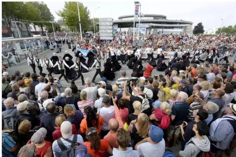
La foule s'amasse lors du passage de la Parade des nations celtes qui change de parcours.

Sur la dernière livraison d'informations, celle-ci est d'importance : la grande Parade des Nations celtes change de parcours. Le dimanche 7 août, à partir de 10 h, elle partira de l'Orient et retrouvera l'hyper-centre, comme dans ses premières années, le Cours de Chazelles, filera vers la place Alsace-Lorraine et rejoindra le stade du Moustoir pour son final (partie payante). À cent mètres près, la parade, captée par France Télévisions, est tout aussi longue. Installé sur l'espace public, le festival a l'habitude de muter au gré des changements urbains. « L'une des raisons est la rénovation de l'avenue de la Marne. Autre point : ce tracé coupe moins la ville en termes de circulation et favorise les transports en commun vers le site. »