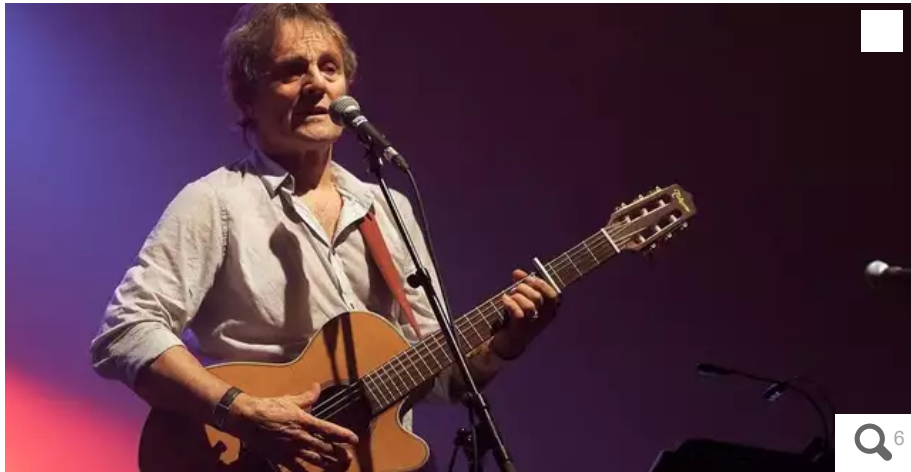
Murray Head sera présent au Festival Interceltique de Lorient, le 6 août

Ce jeudi 7 avril 2022, le Festival Interceltique de Lorient a dévoilé la dernière partie de sa programmation avec une nouvelle myriade d'artistes. Fait notable : la Parade des Nations celtes proposera un parcours liant le Cours de Chazelles au stade du Moustoir.