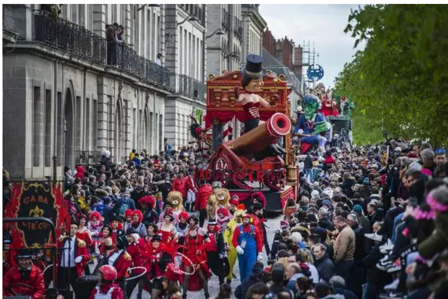
Les Nantais étaient au rendez-vous du carnaval ce dimanche après-midi.