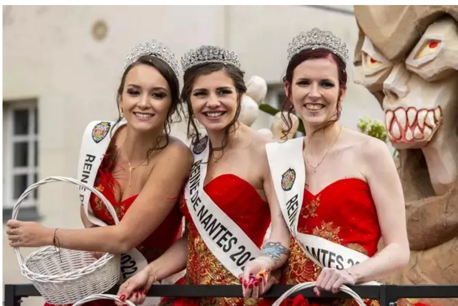
Les reines de Nantes ont pu parader sur un char