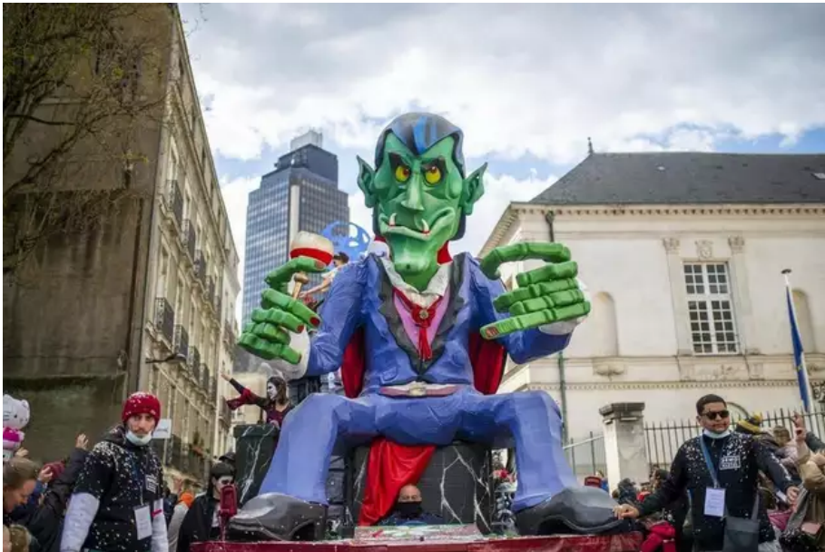
Après deux ans d'absence, le carnaval de Nantes est de retour ce dimanche 3 avril dans les rues nantaises.

Avant de quitter les lieux à vélo, Olivier cite aussi le poulpe comme l'ayant bluffé. Sa compagnie indique avoir apprécié la caricature du président Macron en infirmier fou dans le char « Les Tamalous du Bobola » où figurent des variants du Covid-19. « Si c'est pour rappeler la casse sociale dans le milieu des soignants et la fonction publique, c'est bien vu ».