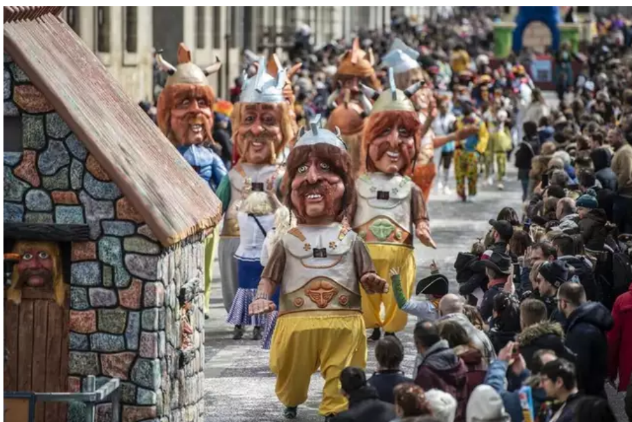
Les grosses têtes ont toujours du succès.