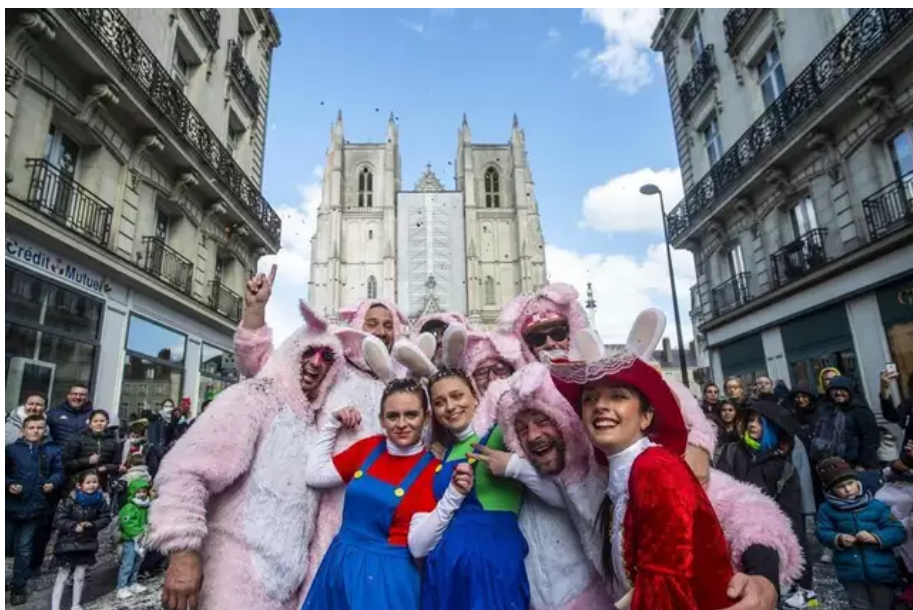
Les carnavaliers n'ont pas boudé leur plaisir.

Pas sûr que ce soit le message initial mais à une semaine de la présidentielle, tout devient politique. Leur fille, Salomé, 7 ans, a « eu peur » de ces géants de papiers impressionnant. Politiquement parlant, on retiendra aussi la « brigade des feuilles d'un pot ou d'impôts » avec Yves, le roi des carnavaliers.