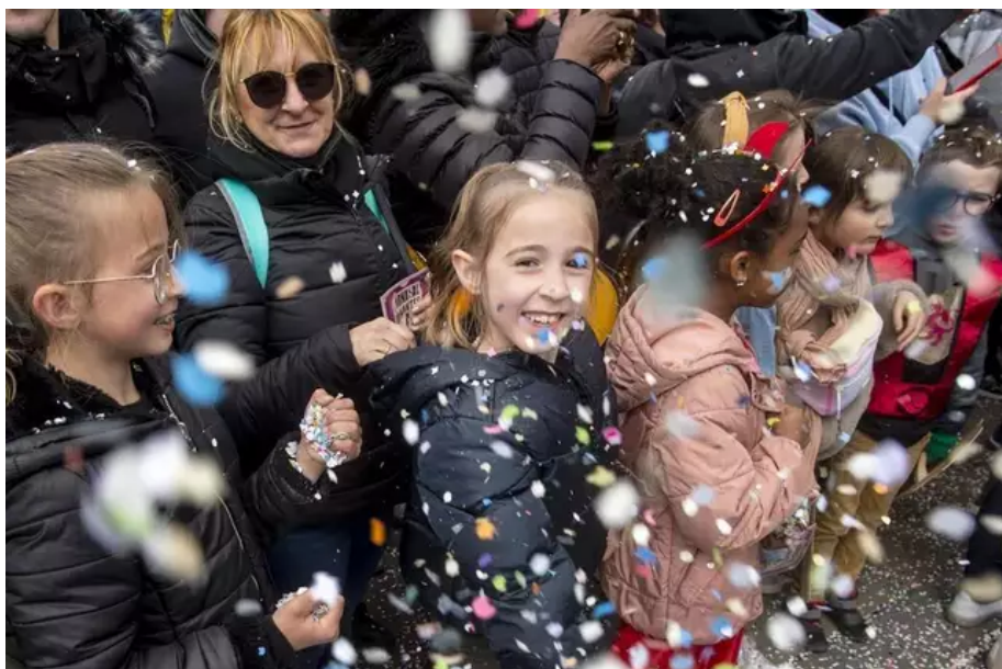
Les confettis ont fait la joie des enfants.