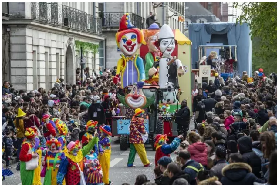
Après deux ans d'absence, le carnaval de Nantes est de retour ce dimanche 3 avril dans les rues nantaises.