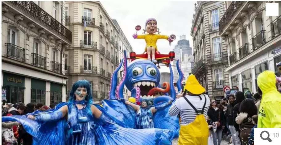
Après deux ans d'absence, le carnaval de Nantes est de retour ce dimanche 3 avril dans les rues nantaises.

De la froidure mais pas de pluie, la météo a été clémente avec le retour des chars du carnaval ce dimanche. Un poulpe géant a fait l'unanimité.