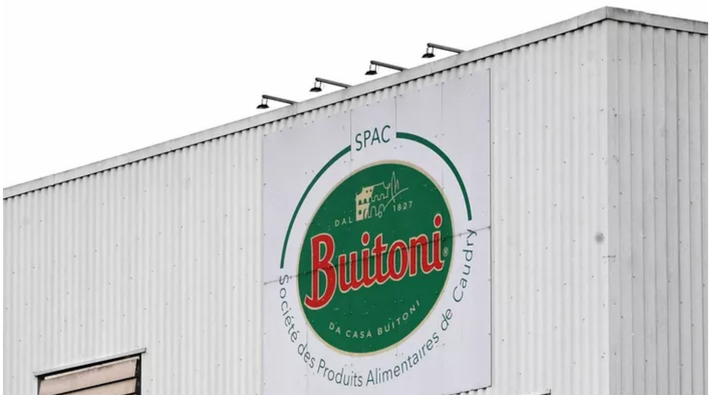
La façade d'une usine Buitoni.

Cette enquête est ouverte depuis le 22 mars. Les autorités sanitaires ont récemment établi un lien entre la consommation de ces pizzas et plusieurs cas graves de contamination, alors que des dizaines d'enfants français sont tombés malades et deux sont morts.