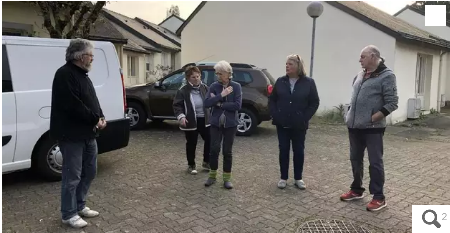
Au hameau du Petit Raffineau, à Orvault (Loire-Atlantique), les habitants n'en peuvent plus des crevaisons à répétition. Une centaine depuis Noël !

Plus d'une quarantaine de crevaisons de voitures en décembre à Orvault. Peut-être soixante ou soixante-dix la semaine dernière. Ça commence à faire beaucoup pour les victimes !