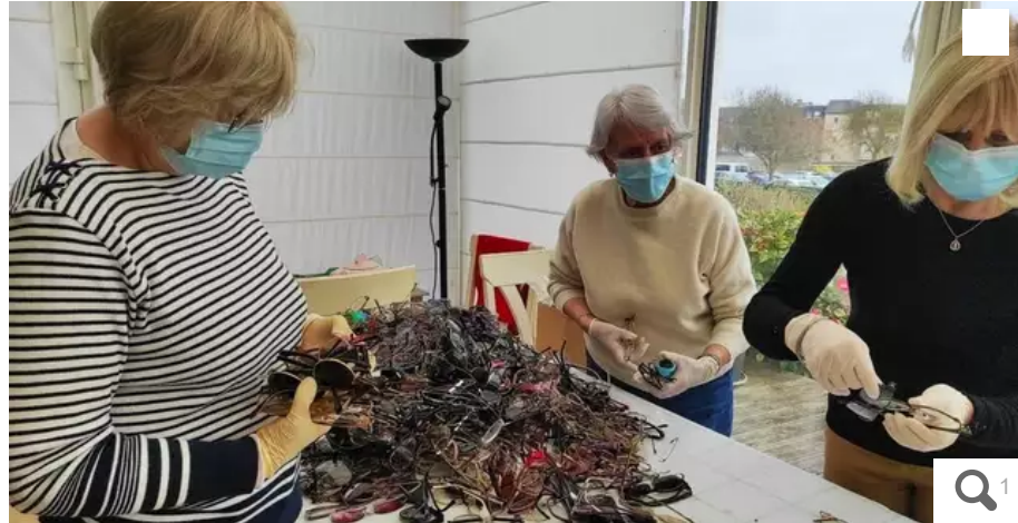
Présent dimanche 3 avril à Fort-Bloqué dans le cadre de la Littorale 56, le Lions-club collecte vos anciennes lunettes.

Partenaire de la Littorale 56, le Lions-club sera présent dimanche 3 avril 2022 à Fort-Bloqué, à Plœmeur (Morbihan) pour collecter d'anciennes lunettes. Reconditionnées, elles seront ensuite expédiées dans des pays où existent des besoins en la matière.