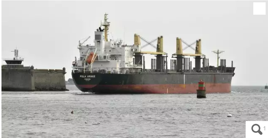
Le cargo russe Pola Ariake a quitté la rade de Lorient à 16 h 43 ce lundi 28 mars 2022.

Le port de commerce de Lorient (Morbihan) a reçu la notification du jugement en début d'après-midi ce lundi 28 mars 2022. Le Pola Ariake a largué les amarres à 16 h 15.