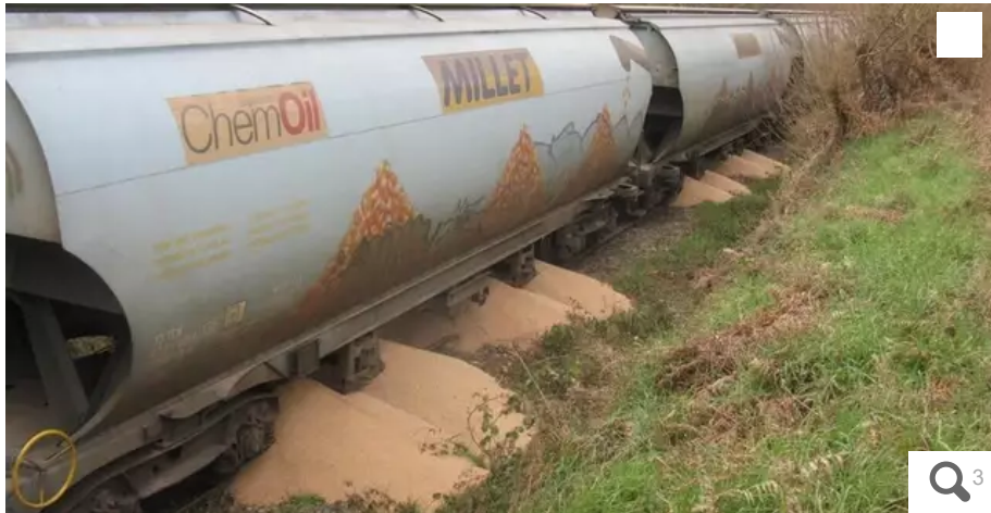
Des centaines de tonnes de blé ont été déversées sur la voie ferrée par une cinquantaine d'activistes du collectif Bretagne contre les fermes usines, entre Saint-Gérand (Morbihan) et Noyal-Pontivy, ce samedi 19 mars 2022 au matin. Au lendemain de cette action coup de poing, le train n'a pas bougé, toujours bloqué par les céréales. Son dégagement est prévu lundi.

Des tonnes de blé ont été déversées sur la voie ferrée par une cinquantaine d'activistes du collectif Bretagne contre les fermes usines, à Saint-Gérand (Morbihan), près de Pontivy, samedi 19 mars 2022. Au lendemain de cette action coup de poing, le train est toujours bloqué. Son dégagement, qui s'annonce compliqué, est prévu lundi. Le convoi n'était pas destiné à l'usine Sanders toute proche, comme le pensaient les militants, mais à une autre fabrique d'aliment pour bétail.