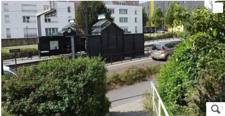
Le guet-apens s'était déroulé dans la nuit du 7 au 8 mai 2017, à la station de tramway Du Chaffault à Nantes.

Le soir de la présidentielle 2017, ils avaient pris deux jeunes cyclistes pour des anti fascistes et leur avaient tendu une embuscade. Quatre hommes sont jugés à compter de ce lundi 21 mars à Nantes.