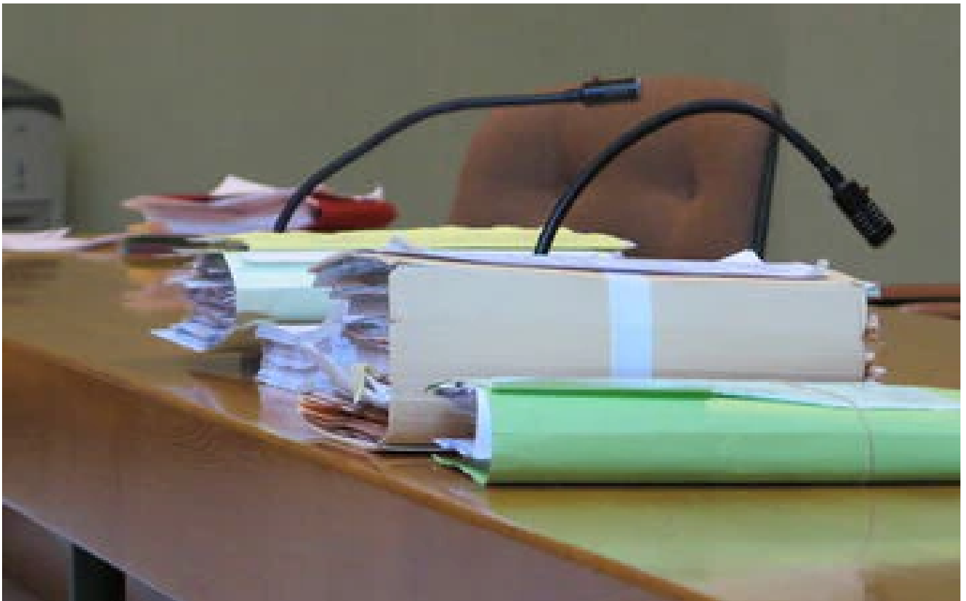
Abonnés Tentative de féminicide : un homme condamné à 12 ans de prison pour avoir frappé sa compagne à coups de marteau