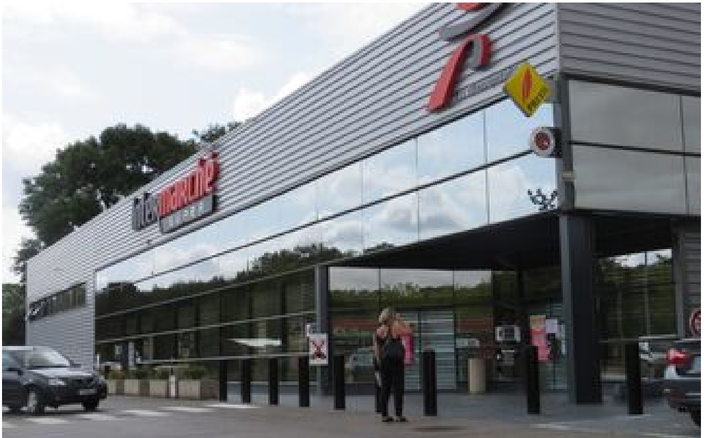
Abonnés « Il fallait protéger les autres » : la bravoure de l'ex-responsable de l'Intermarché braqué dans l'Oise