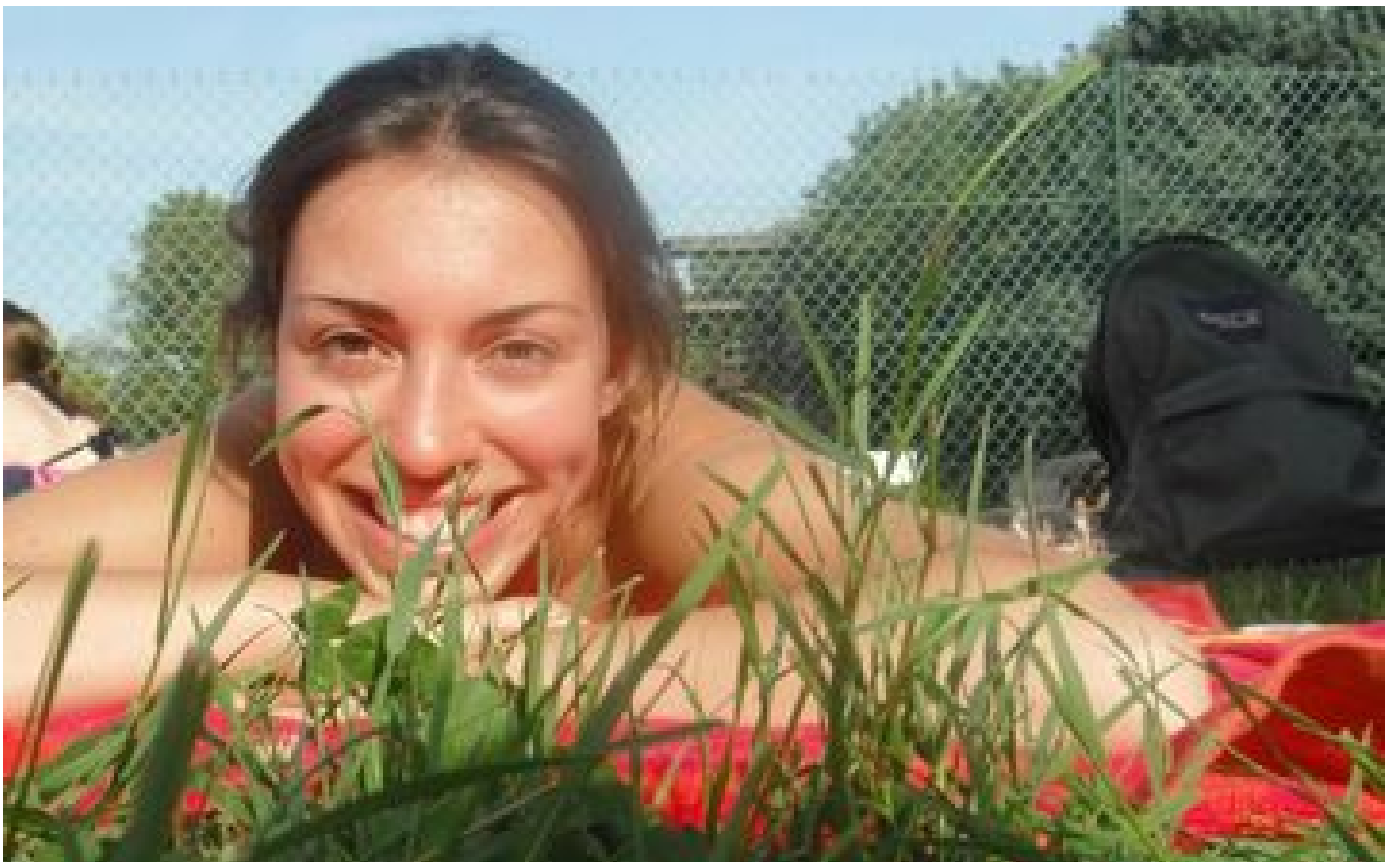
Maladie de Creutzfeldt-Jakob : l'Inrae reconnaît la mort d'agents probablement contaminés par des accidents