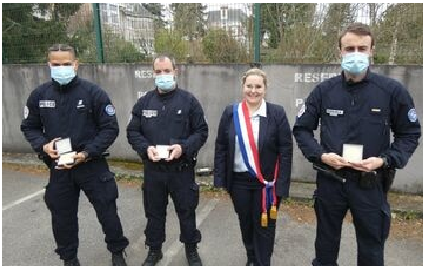
Abonnés Attaque au couteau à Arpajon : les trois policiers récompensés pour leur intervention racontent «le chaos»