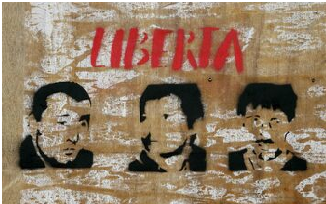
Agression d'Yvan Colonna : la justice accorde une suspension de peine à l'assassin du préfet Erignac