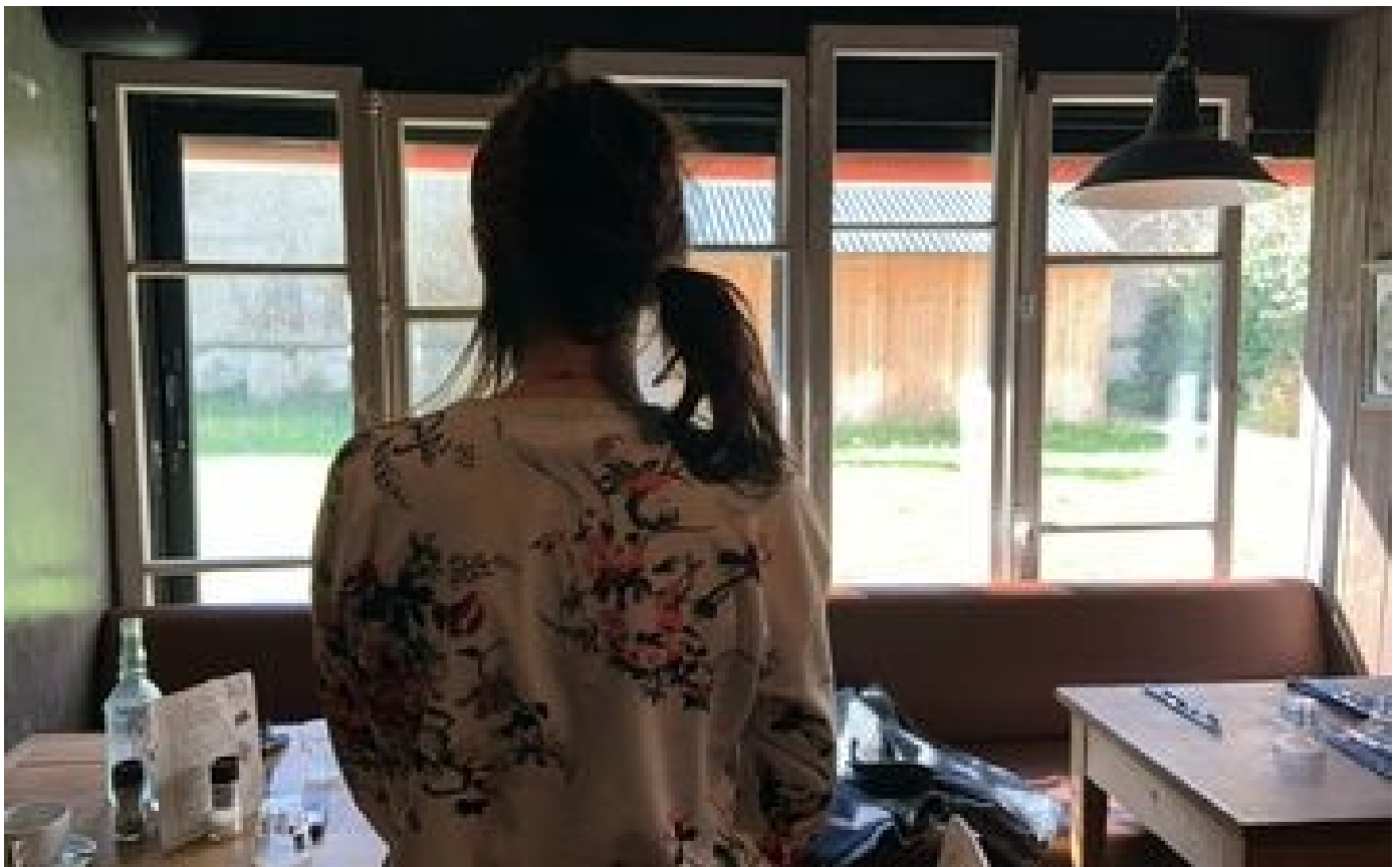
Abonnés « Je suis une miraculée » : lardée de coups de couteau par son voisin à Paris, cette maman raconte son calvaire