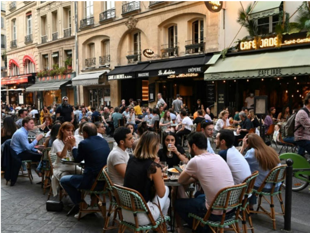
Des terrasses à Paris

A partir du 1er avril, les terrasses estivales seront de retour dans les rues de Paris. Un sujet brûlant aussi