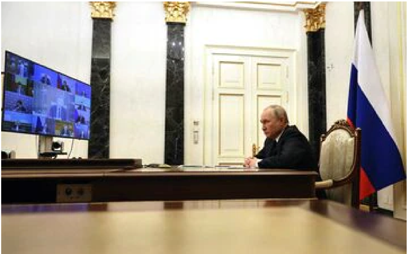
Guerre en Ukraine : Vladimir Poutine met en garde contre une inflation mondiale des prix alimentaires