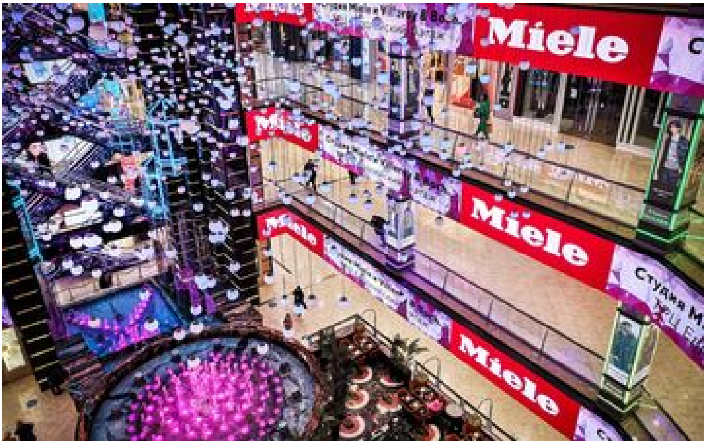
Guerre en Ukraine : la Russie interdit d'exporter certains produits qu'elle avait fait importer