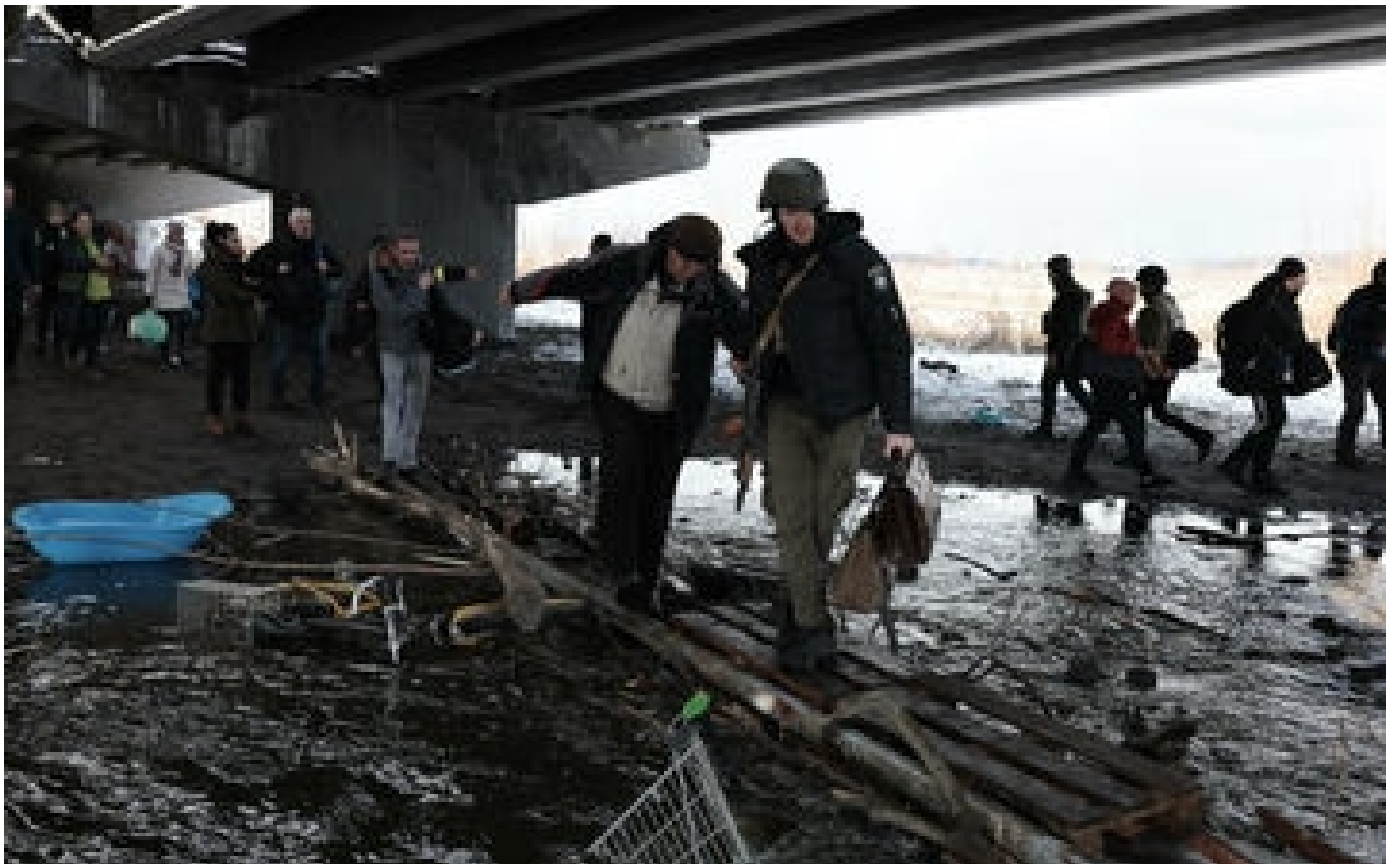
Guerre en Ukraine : la moitié de la population de Kiev a fui depuis le début de l'invasion russe