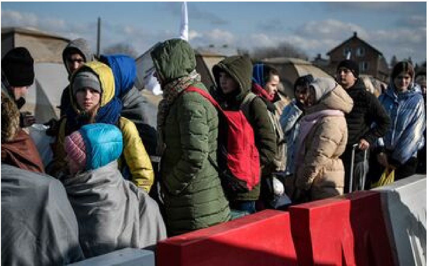
Londres simplifie la procédure d'entrée des Ukrainiens au Royaume-Uni