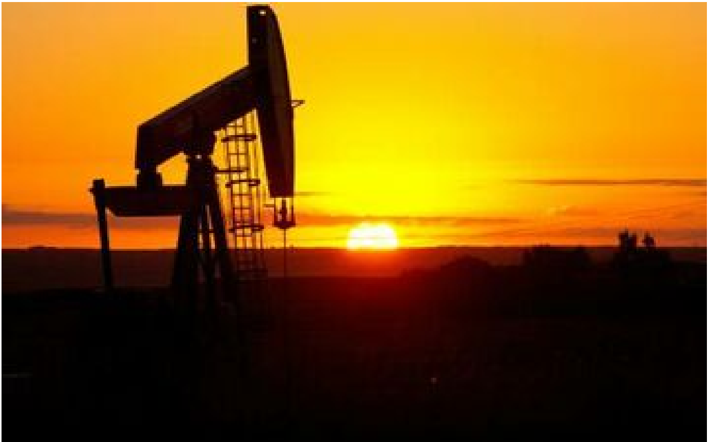
La Russie dit maintenir toutes ses exportations énergétiques vers l'Europe