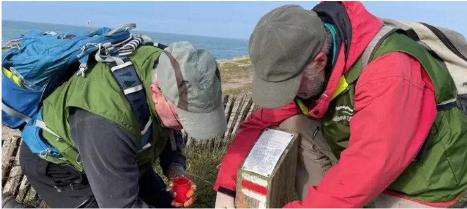
Si les couleurs rouge et blanche indiquent un GR, les couleurs jaunes et rouges sont dédiés à un GRP (un chemin de grande randonnée de pays).