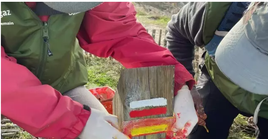
Pour baliser la randonnée, il faut se salir les mains.

Cette fois-ci les couleurs des tracés sont jaune et rouge. « Le balisage est normé en termes de forme et de couleur , expliquent-ils. Pour la forme, nous avons différents pochoirs. Pour la couleur, contrairement aux GR, qui sont identifiés par du rouge et du blanc, le GR de Pays est caractérisé par du jaune et du rouge. »