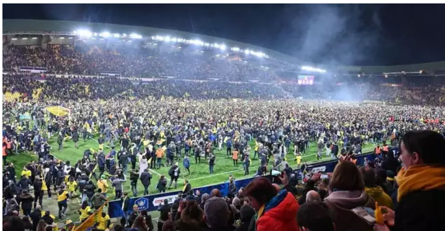
La foule a envahi la pelouse de la Beaujoire, après le coup de sifflet final.