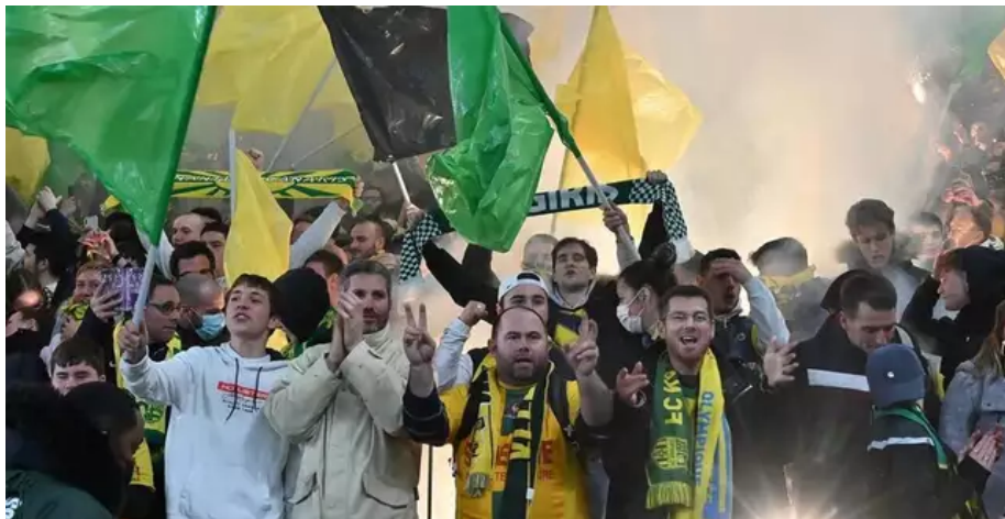
Les joueurs ont pu compter sur un public motivé.