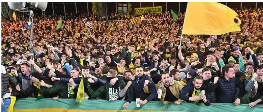
Le match s'est joué à guichets fermés, devant 34 000 spectateurs.

Une fierté qui résonnera sans doute dans l'enceinte du Stade de France pour la finale. Mais quand ? Un commentaire d'un supporter a peut-être été lu par la Fédération française de football (FFF) : « Quelqu'un peut-il me dire pourquoi la finale se jouera le 8 mai, un dimanche ! C'est n'importe quoi », s'étonne Florian Dalibert.