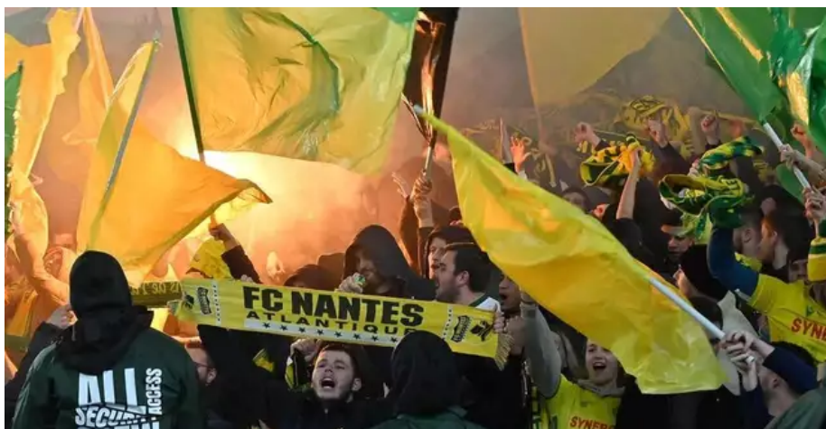
Les supporters ont explosé de joie.

Les commentaires sur notre page Facebook Ouest-France Nantes sont élogieux. Beaucoup saluent les joueurs pour ce moment de bonheur, alors que la guerre fait rage en Ukraine.