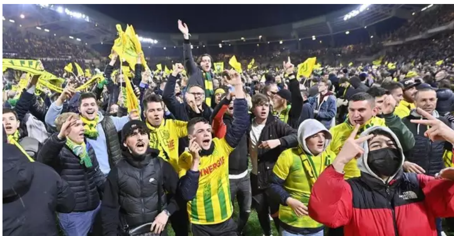
Des supporters de tous âges ont célébré cette qualification en finale.