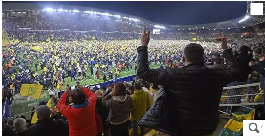
La foule a envahi la pelouse de la Beaujoire, après le coup de sifflet final. Le FC Nantes a battu Monaco et s'est qualifié pour la finale de la Coupe de France.

Les Canaris se sont qualifiés hier soir, mardi 2 mars, pour leur première finale de Coupe de France depuis 2000. Un moment de joie intense et de folie à la Beaujoire, partagé par tous les supporters du FC Nantes. Retour en photos sur cette soirée après le succès face à Monaco.