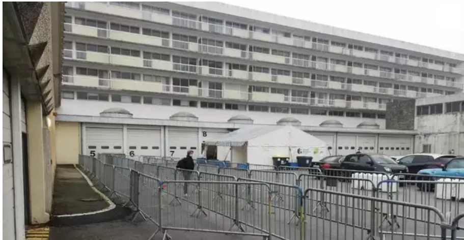
Ce mercredi matin 12 janvier 2022, le centre de dépistage de la rue Dunant (Lorient) est déserté.