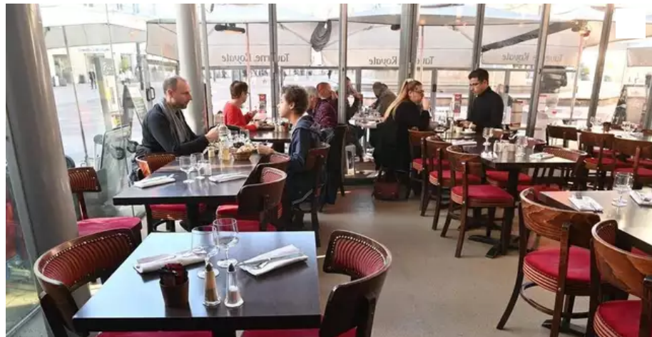
La généralisation du télétravail affecte la fréquentation des restaurants nantais.

La propagation du virus et l'appel du gouvernement à généraliser le télétravail affectent la fréquentation des restaurants et boutiques. Reportage dans le centre de Nantes.