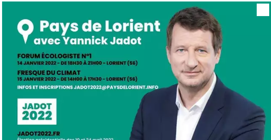
Deux rendez-vous sont annoncés par le comité de soutien du pays de Lorient à Yannick Jadot.

Dans le cadre de la campagne du candidat écologiste Yannick Jadot à la présidentielle, le comité local de soutien du pays de Lorient (Morbihan) organise un forum le 14 janvier 2022 et une fresque du climat le 15 janvier.