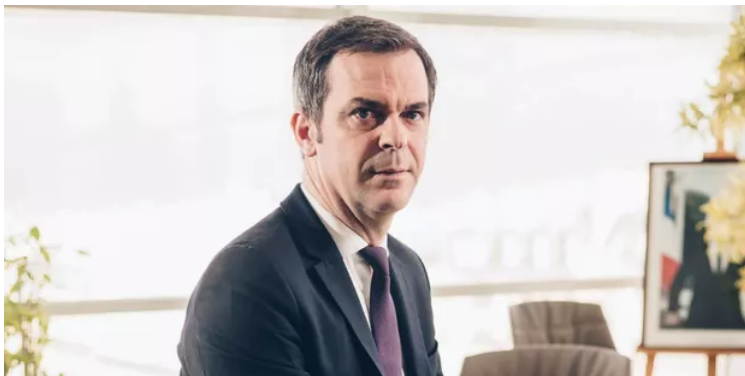
Olivier Véran, ministre des Solidarités et de la Santé, dans son bureau du ministère à Paris, le 30 décembre.

ABONNÉS INTERVIEW - Le ministre des Solidarités et de la Santé, Olivier Véran, dévoile au JDD les nouvelles règles d'isolement des personnes positives et cas contact. Le gouvernement accentue la pression sur les non-vaccinés.