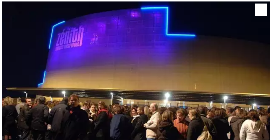
Le Zénith de Nantes métropole accueille généralement entre 2 500 et 9 000 spectateurs à chaque spectacle, comme ici pour Patrick Bruel

Conséquence directe des dernières annonces gouvernementales, les Zéniths, dont celui de Nantes, ferment à partir du 3 janvier 2022. Tous les concerts, prévus jusqu'au 24 janvier, sont de fait annulés.