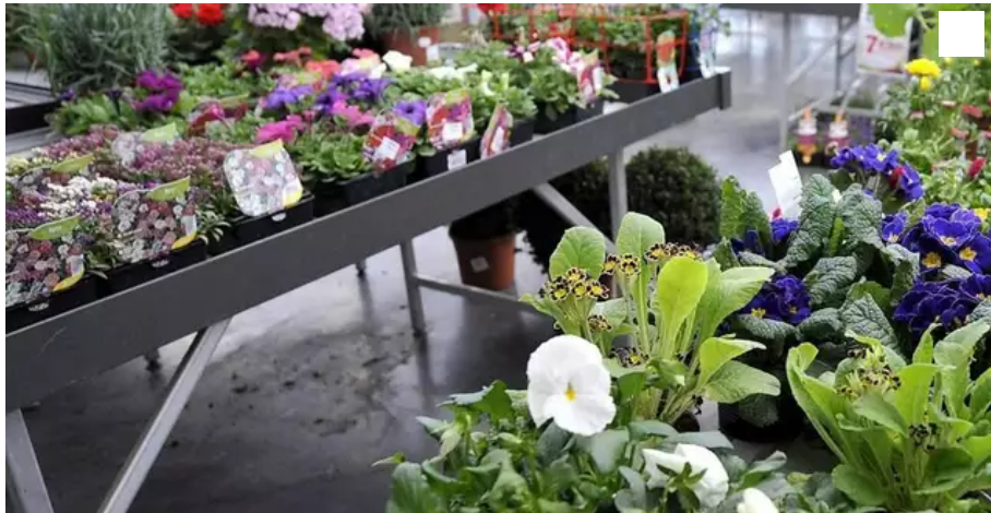
La jardinerie sera fermée du 1er au 7 janvier 2022, le temps de se réaménager sous l'enseigne Botanic.

La jardinerie Truffaut, du centre commercial Keryado K2, à Lorient (Morbihan), sera fermée du 1er au 7 janvier 2022, pour faire sa mue. Elle passe sous l'enseigne Botanic, spécialisée dans le jardinage écologique.