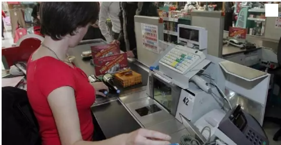
La jeune femme a carrément giflé la cliente qui l'avait énervée, de même que le gérant du magasin...