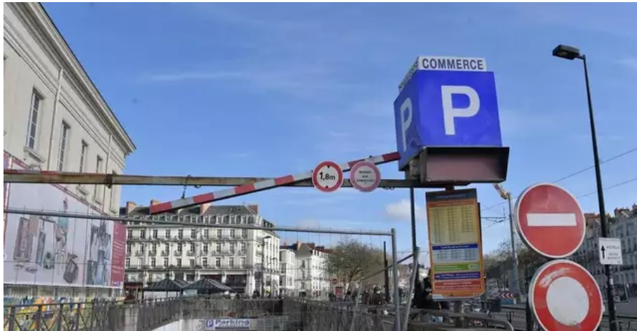
Le parking rouvrira mi-janvier 2022, sous réserve du passage de la commission sécurité », confirme la ville de Nantes

Pour accompagner les habitants dans leurs déplacements en cette période de fin d'année, la fréquence de certaines lignes sera augmentée. L'offre sur les lignes 1, 2, 3, 4, 5 et C2 sera renforcée ce dimanche 19 décembre, avec l'ouverture des commerces de 12 h à 19 h. La Semitan a aussi revu son offre de nuit des vendredis et samedis (plus de tramways et de busways de 22 h 30 à 0 h 30). Rappelons que les transports en commun sont gratuits les week-ends.