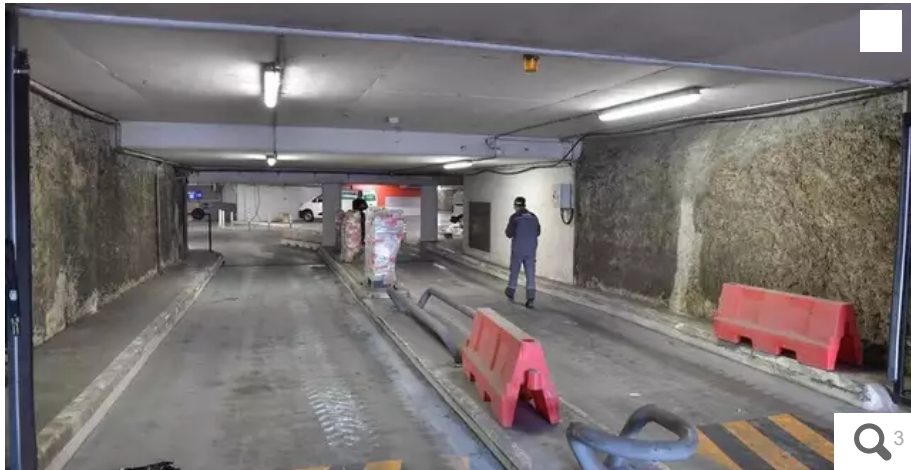
Construit dans les années 80, le parking souterrain de la place Commerce subit une importante cure de jouvence.

Fermé depuis le 1er février, le parking souterrain Commerce, à Nantes, devait rouvrir ce mois-ci, après d'importants travaux. L'ouverture a été repoussée. D'autres solutions existent pour stationner en ville.