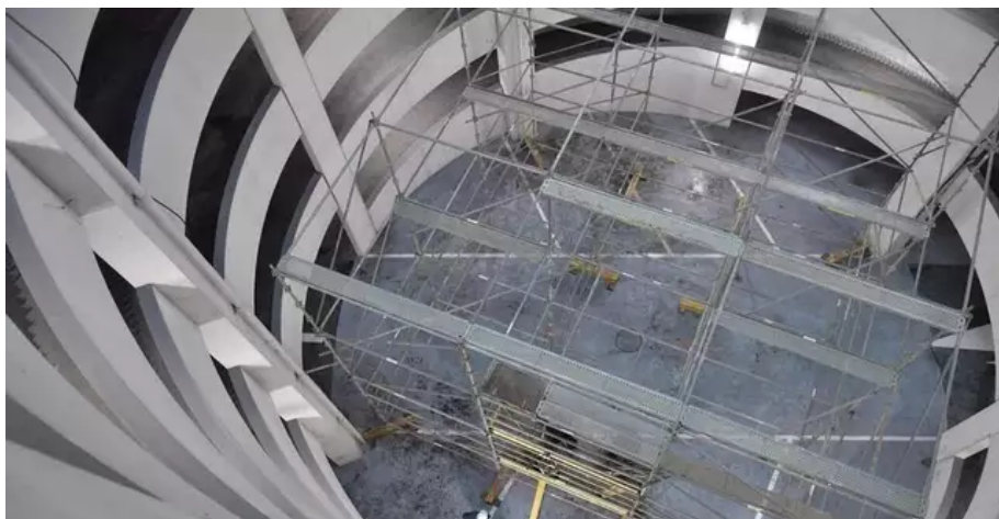
Nantes gestion équipement (NGE) a piloté les travaux du parking du Commerce avec le maître d'œuvre EPBV.

Construit dans les années 80, le parking souterrain de la place Commerce subit une importante cure de jouvence. Depuis le 1er février 2021, les ouvriers s'activent : réfection, mise aux normes... Nantes gestion équipement (NGE) a piloté les travaux du parking du Commerce avec le maître d'œuvre EPBV. Coût du chantier : 4,13 M€ HT. La réouverture était prévue en décembre 2021.