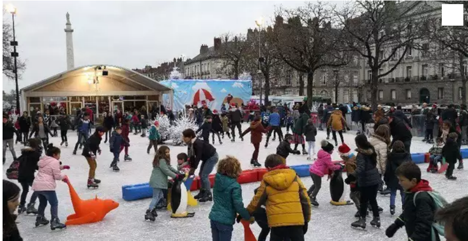
La patinoire en plein air et les six couloirs de luge ne seront pas rouverts cette année encore.

Les amateurs de patin à glace et les jeunes pousses qui aiment la luge n'auront pas la chance de s'amuser cours Saint-Pierre cette année.