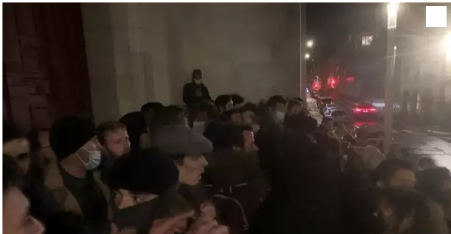
Ambiance tendue ce mardi soir devant l'église Notre-Dame-de-Bon-Port.

Des traditionalistes ont empêché la tenue d'un concert du Lieu unique, ce mardi 7 décembre, à l'église Notre-Dame-de-Bon-Port. Le diocèse avait pourtant donné son accord.