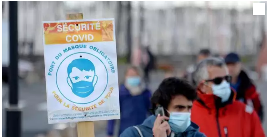
Dans le Morbihan, le port du masque est désormais obligatoire dans les communes de plus de 5 000 habitants, le week-end, à partir du vendredi 19 h jusqu'au dimanche, 22 h.

En raison de la dégradation de la situation sanitaire dans le Morbihan, le port du masque est obligatoire dans les communes de plus de 5 000 habitants, le week-end, à partir du vendredi 19 h jusqu'au dimanche 22 h. Et ce, à compter du 1er décembre 2021