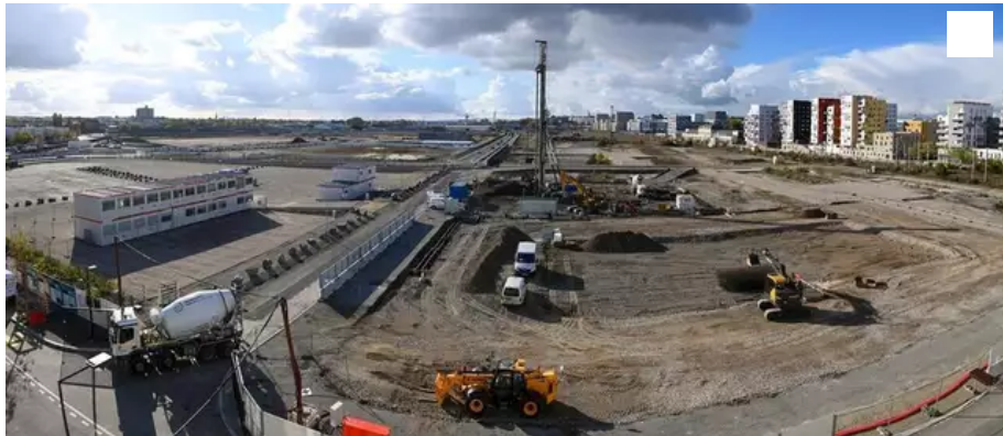
Les opposants bien que désunis attendent beaucoup de l'enquête expresse que la Chambre régionale des comptes va sans doute réaliser sur le projet du futur CHU de l'île de Nantes.

Ils se réjouissent de la possible enquête expresse de la chambre régionale des comptes sur le futur CHU mais ne sont plus regroupés en collectifs. Gauche et droite se séparent.