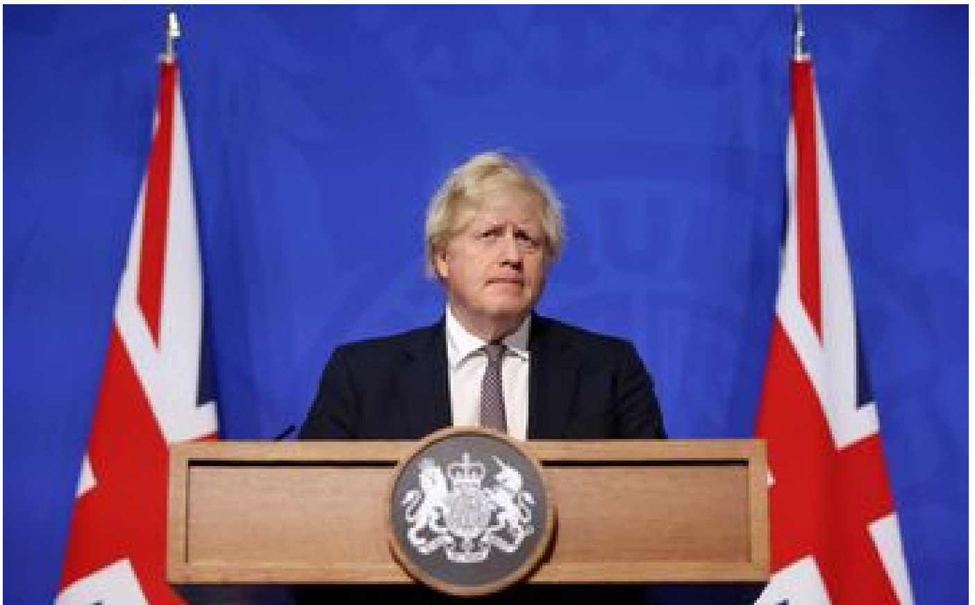
Variant Omicron : isolement obligatoire des voyageurs, test à l'arrivée, retour du masque... Ce qui change au Royaume-Uni