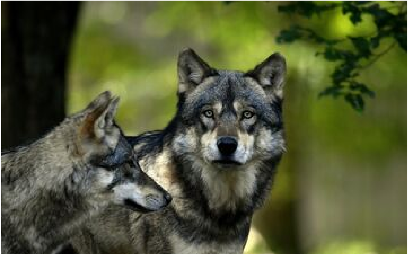
Abonnés Vivre avec le loup ?