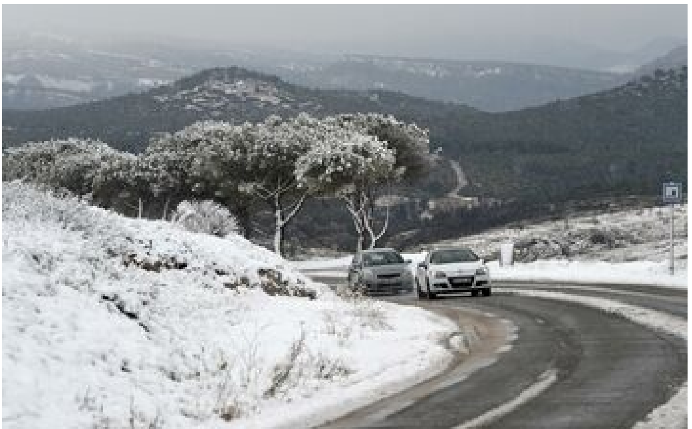
Neige et verglas : 11 départements en vigilance orange