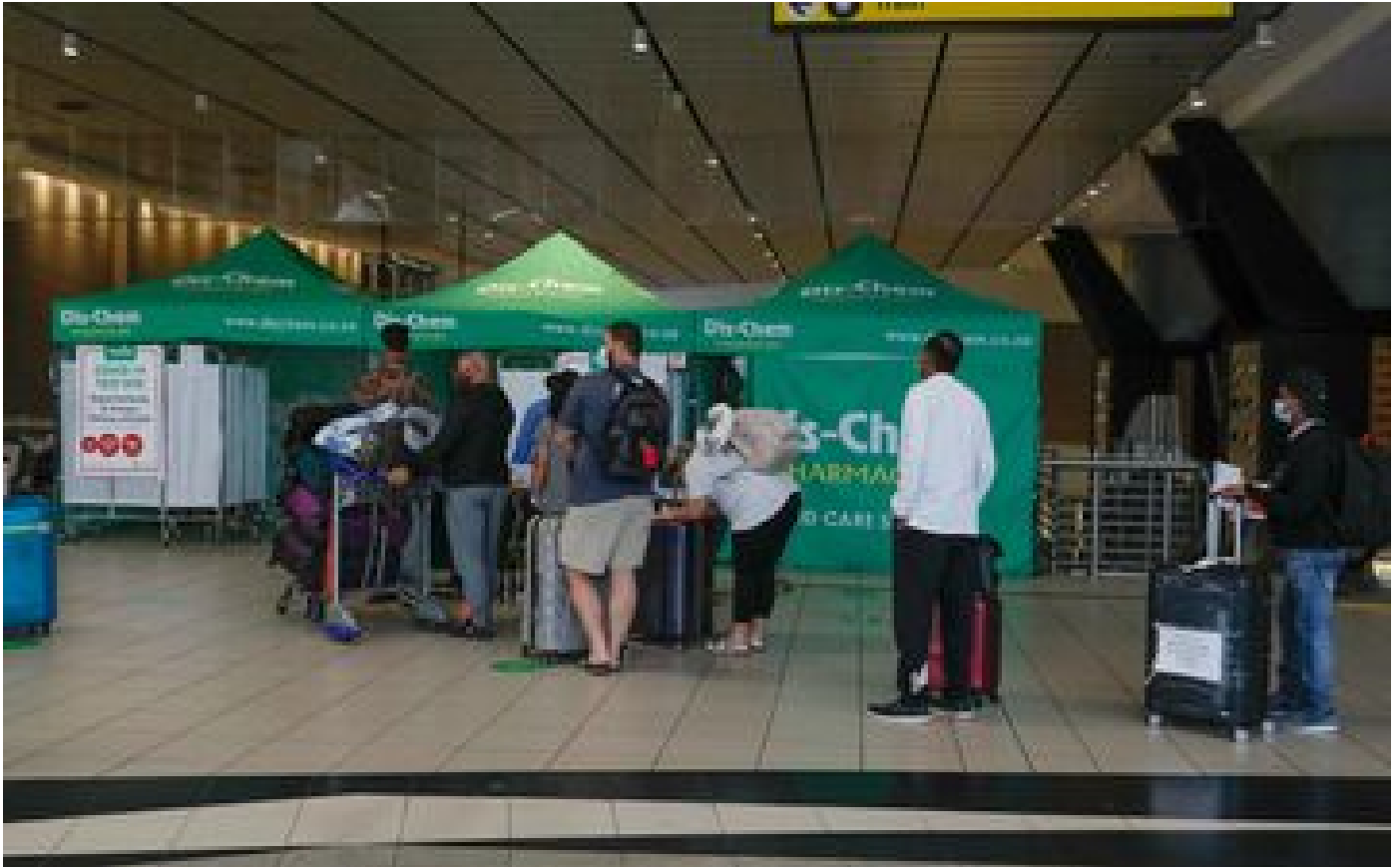
Variant Omicron : pointée du doigt et fuite par les Européens, l'Afrique du Sud s'estime «punie»