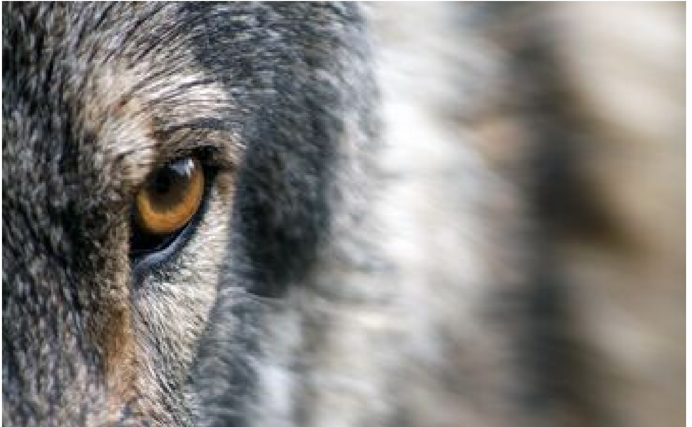
Abonnés Retour du loup : la bête, cauchemar du Gâtinais en 1652