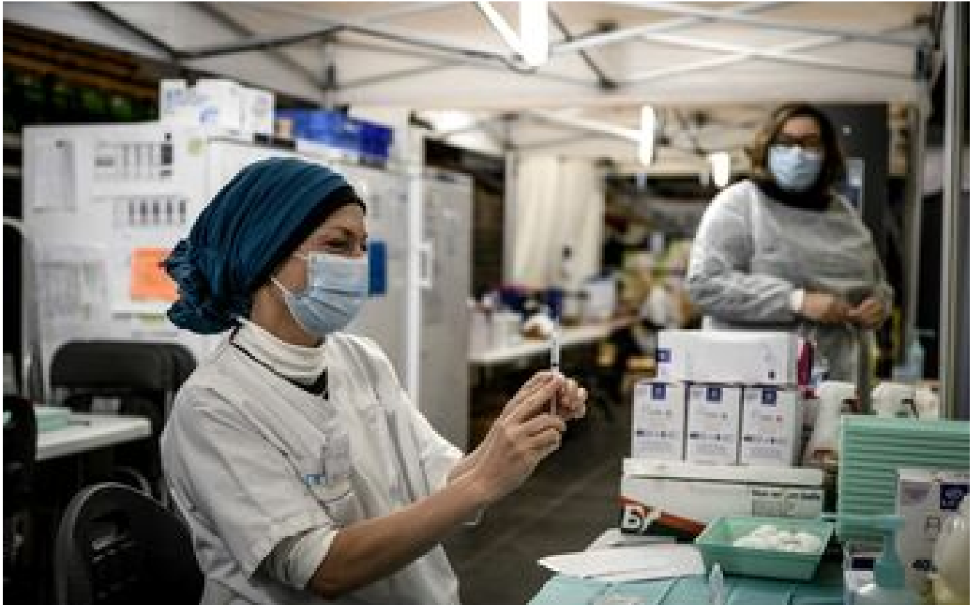
Covid-19 en France : 34 nouveaux décès et plus de 37000 cas enregistrés en 24 heures