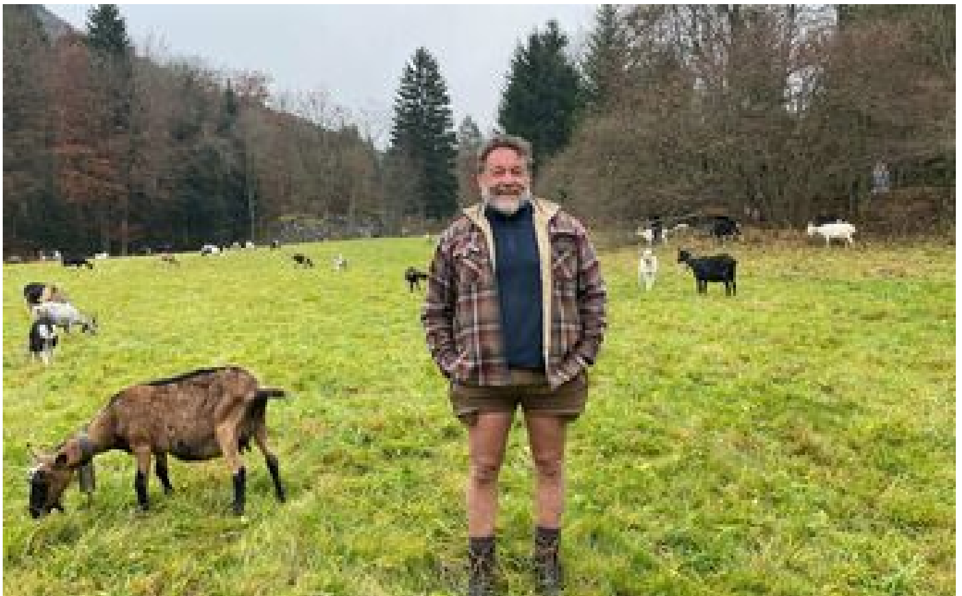
Abonnés Attaques de loup : colliers à ultrasons, chiens protecteurs... les éleveurs cherchent la parade