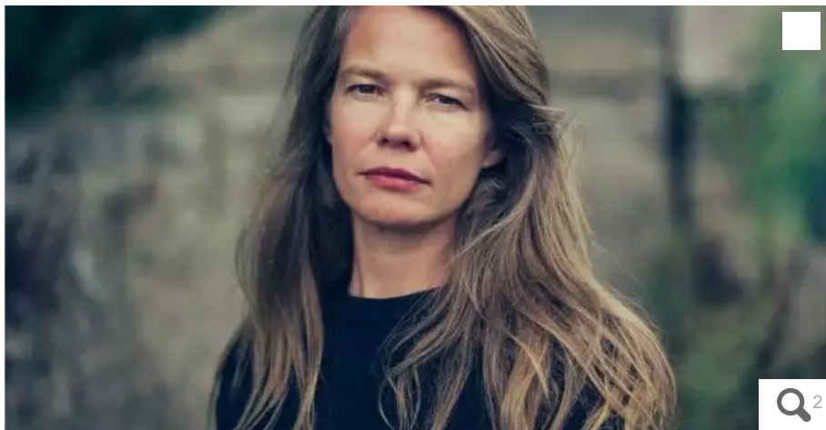
Catherine Le Gall, journaliste, auteure de « L'imposture océanique », éditions La Découverte (18,50 €).

Lors de la Journée mondiale des pêcheurs, qui a lieu jeudi 25 novembre 2021 à Lorient (Morbihan), à l'Université de Bretagne Sud, la journaliste Catherine Le Gall parlera du « pillage écologique des océans par les multinationales ». Une façon de réhabiliter les pêcheurs.