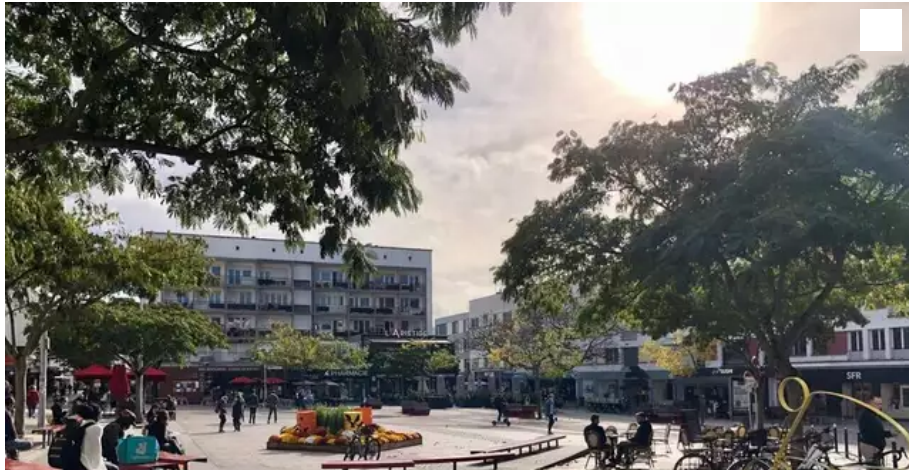
La Ville va consulter les habitants pour redessiner le centre-ville, ses places (comme ici Aristide-Briand).

Quel centre-ville demain à Lorient (Morbihan) ? Après les commerçants et les institutionnels, la Ville appelle les habitants à s'exprimer. Une réunion d'information aura lieu le 10 novembre 2021.