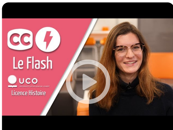
La Licence d'Histoire de l'Université Catholique de Louvain