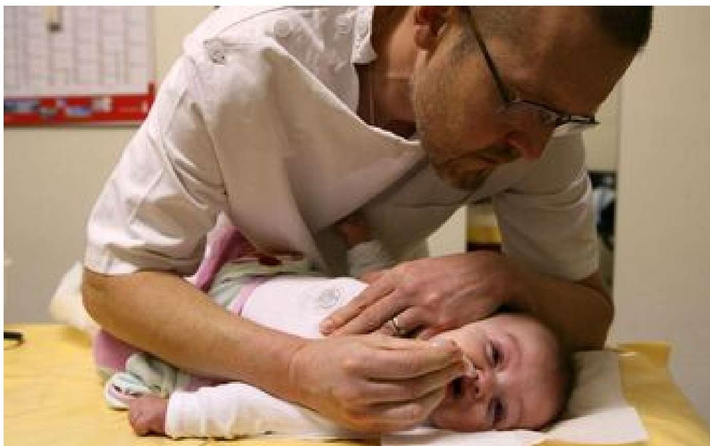
Bronchiolite : le stade épidémique atteint presque partout en France