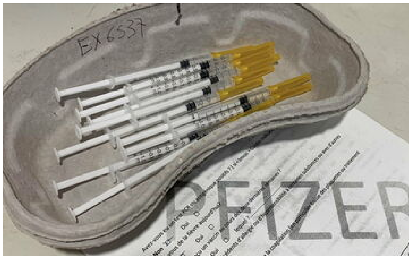
Covid-19 : la troisième dose du vaccin Pfizer efficace à 95,6%, annonce le laboratoire