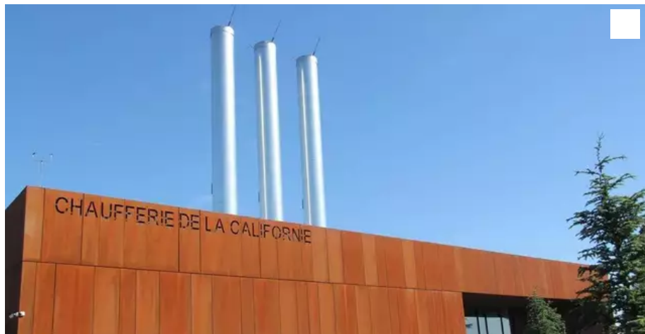
La chaufferie bois de Trentemoult, implantée sur le secteur de la Petite-Californie, en bordure de la route de Pornic.

C'est l'une des conclusions du commissaire-enquêteur qui s'est penché sur la centrale thermique de Trentemoult, au sud de Nantes. Il appelle à une grande vigilance sur les calculs, les réglages et les contrôles.