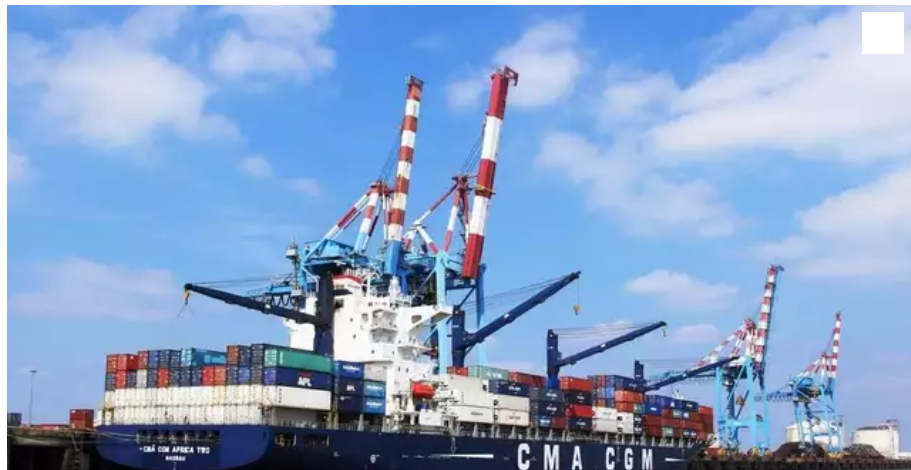
La drogue était déchargée sur la plate-forme à conteneurs de Montoir-de-Bretagne, selon la technique dite du rip-off.

Sept hommes dont deux dockers ont été condamnés, ce jeudi 21 octobre à Rennes, à des peines d'emprisonnement de quatre à dix ans pour avoir participé à l'importation de cocaïne dans des conteneurs depuis les Antilles entre 2017 et 2020.