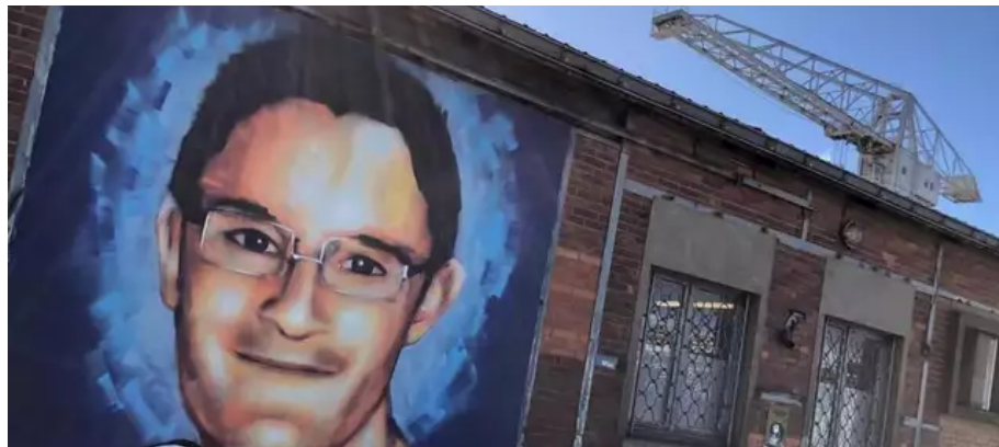
Une nouvelle fresque du jeune homme est récemment apparue quai Wilson.