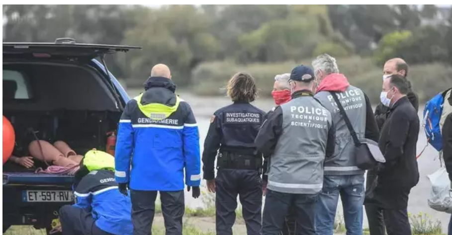
Une reconstitution avait eu lieu en mai 2021.

Les investigations pointent aujourd'hui du doigt un ensemble de décisions liées à la sécurité et au moment de l'intervention de police menée sur le quai Wilson, un site appartenant à l'État dépourvu de barrières de sécurité. Face à des individus provocateurs et violents, les fonctionnaires ont fait usage de trente-trois tirs de grenades lacrymogènes, dix grenades de désencerclement et douze tirs de lanceur de balle de défense (LBD). Une réponse « pas adaptée » , selon un rapport de l'IGA, le corps d'inspection du ministère de l'Intérieur.