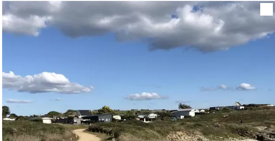
Les habitations vues du sentier côtier à Plœmeur (Morbihan).

Quelle est la réglementation pour installer une habitation légère ou un mobile-home, sur un « terrain de loisirs » inconstructible, dans le Morbihan ? Ce n'est pas toujours très clair.