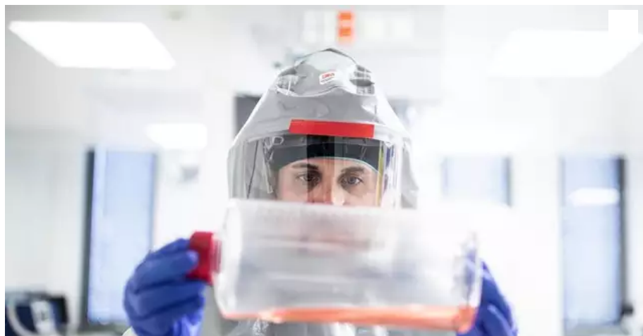
Un technicien de Valneva observe une culture de virus, en août 2020.

Le gouvernement britannique a « résilié » son contrat portant sur 100 millions de doses du candidat vaccin contre le Covid-19 du laboratoire franco-autrichien Valneva, basé près de Nantes.