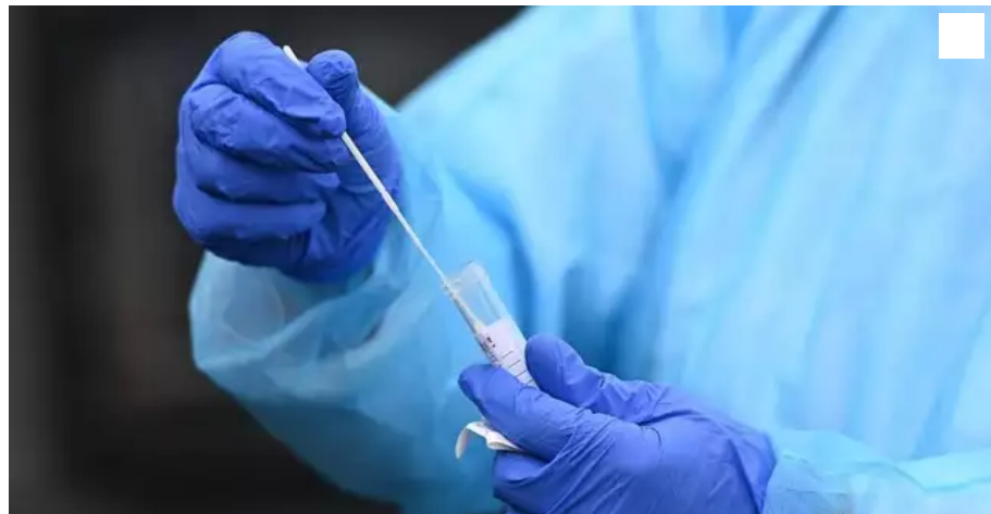
Les dépistages Covid-19.

Comprenez-vous que les enseignants ne soient pas soumis au passe sanitaire ?