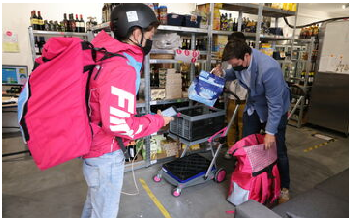
Abonnés Livraison de courses à domicile : Flink bat les records du quick commerce