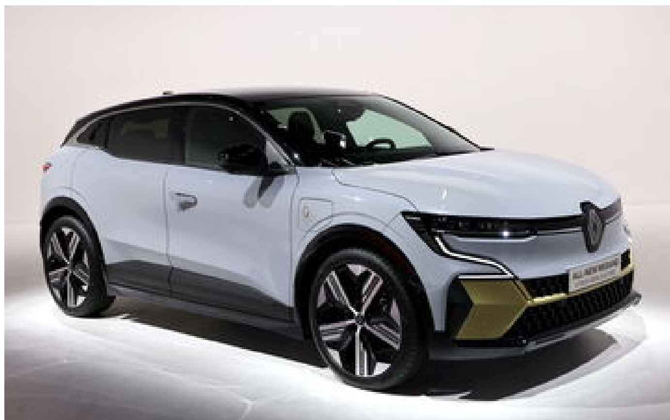
Abonnés Renault dévoile la MéganE, son véhicule familial 100% électrique