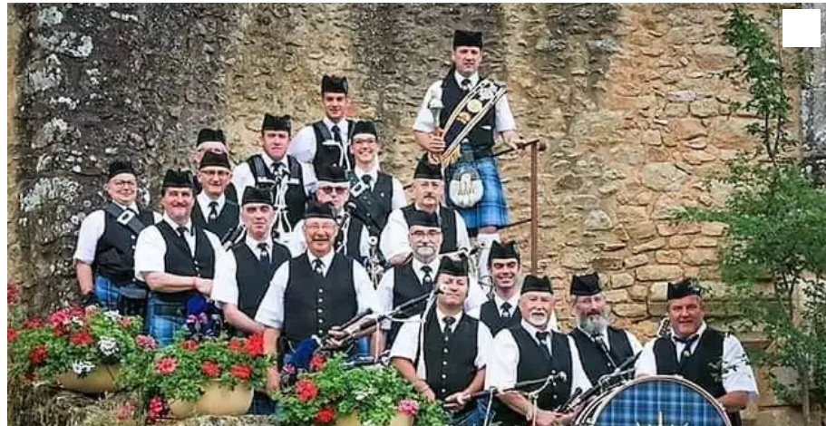
Le Lorient Pipe Band Brittany se rendra en Isère à l'occasion du festival.

Les 4 et 5 septembre 2021, le Pipe Band de Lorient (Morbihan) se produira au Festival de musiques militaires de Porcieu-Amblagnieu, en Isère.