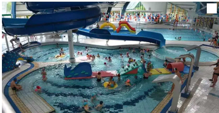
La piscine Océanis ouvrira, à nouveau ses bassins au public à compter du 13 septembre.

Si le centre aquatique de Plœmeur (Morbihan), Océanis, démarre le mois de septembre par une fermeture technique du 30 août au 12 septembre 2021, elle prépare la rentrée avec les journées d'inscription.