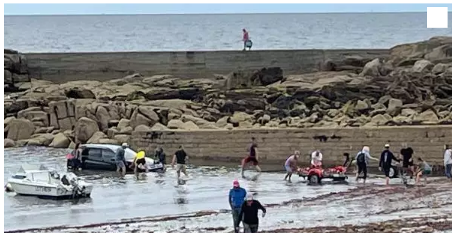
Plusieurs personnes se sont affairées pour sortir la remorque puis le véhicule immergé.