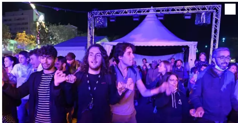
La scène Bretagne avec en fond, la fête foraine.