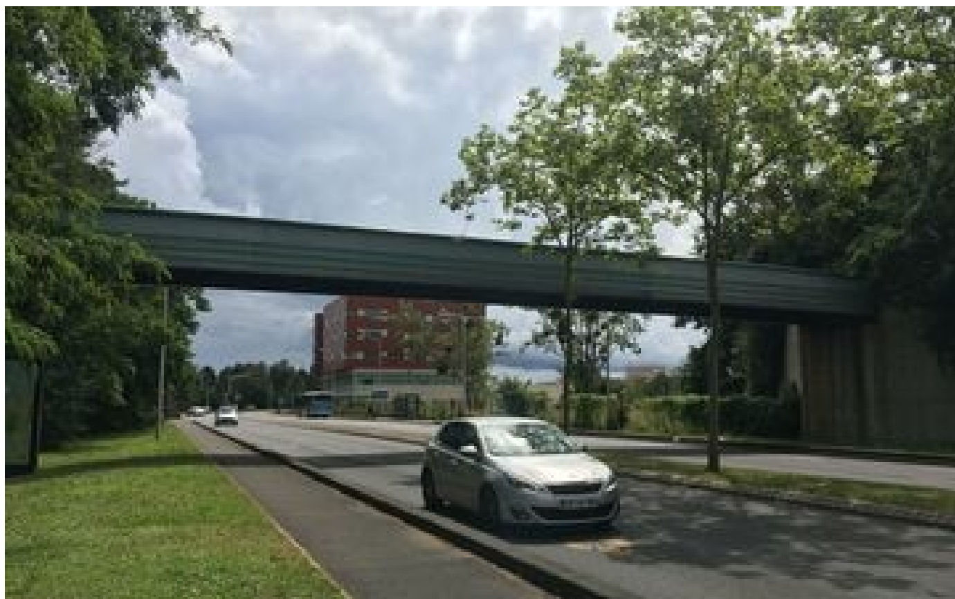
Essonne : une femme sauvée in extremis par des policiers alors qu'elle allait se jeter d'un pont