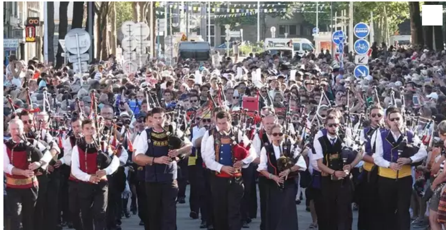
La Grande parade aura lieu cette année dans une formule adaptée.

S'il a restreint sa programmation, le Festival Interceltique de Lorient (FIL), emblème de la musique celtique, se tiendra du 6 au 15 août. Pour son 50e anniversaire, il célébrera la Bretagne.