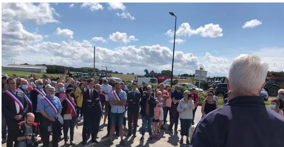
Lors d'une prise de parole, le maire de Landévant a dit « se sentir lâché et veut voir l'État agir ».