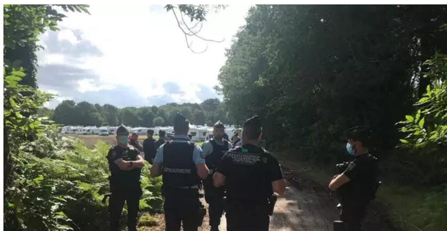
Ce mercredi matin, une cinquantaine de gendarmes sont sur le site de Merlevenez.

Ce mercredi, à 11 h, une trentaine de tracteurs sont arrivés au point de ralliement de Beg er Lann. Sont là les maires de Locmiquélic, Nostang, Riantec, des élus de Merlevenez, Plouhinec, etc., le député Jimmy Pahun. Une cinquantaine de gendarmes sont déployés aux abords.