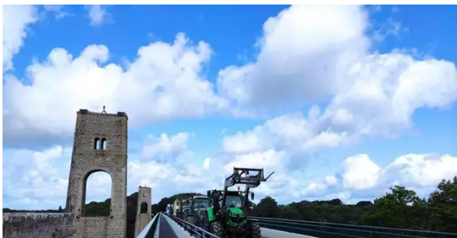
Les agriculteurs de Lanester ont traversé le Pont du Bonhomme.

Les agriculteurs de Lanester ont traversé le Pont du Bonhomme.