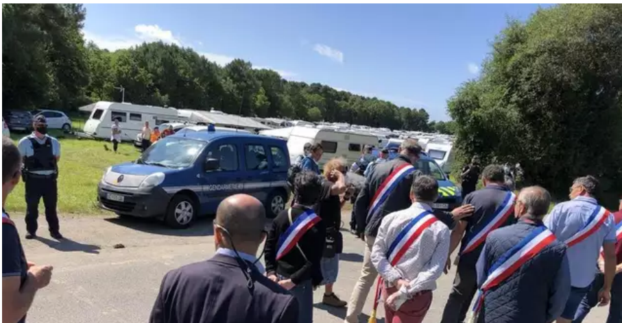
À 12 h 19, le cortège d'élus et d'agriculteurs passe devant les caravanes.

À 12 h 19, le cortège d'élus et d'agriculteurs passe devant les caravanes.