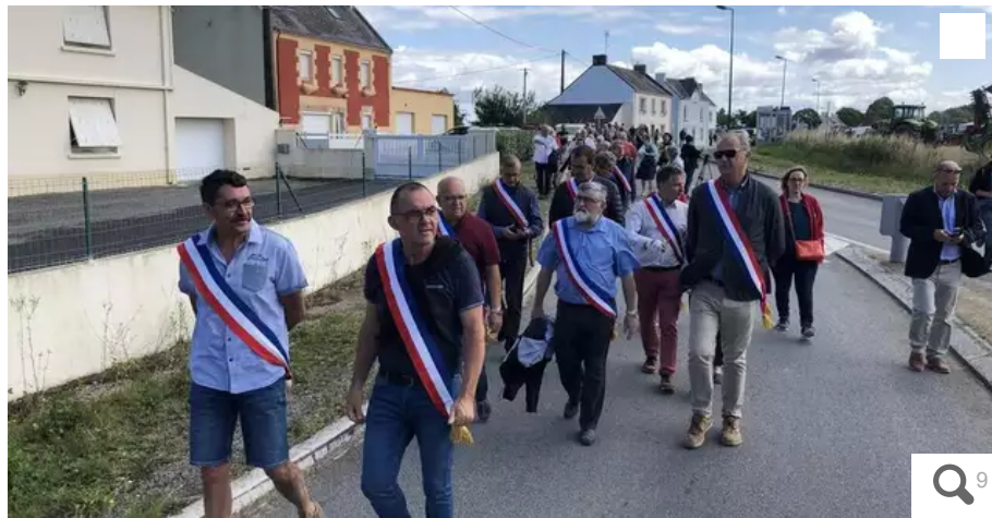
À 12 h, le cortège d'élus et d'agriculteurs s'est élané.