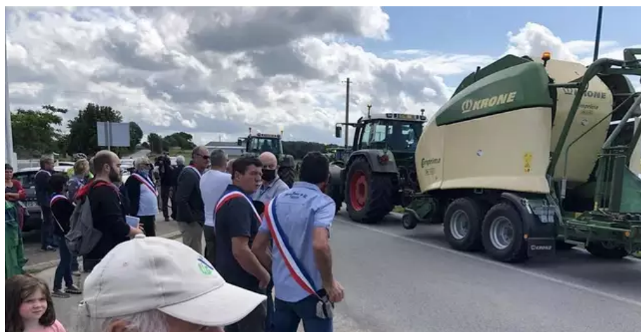
Ce mercredi, à 11 h, une trentaine de tracteurs sont arrivés au point de ralliement de Beg er Lann.