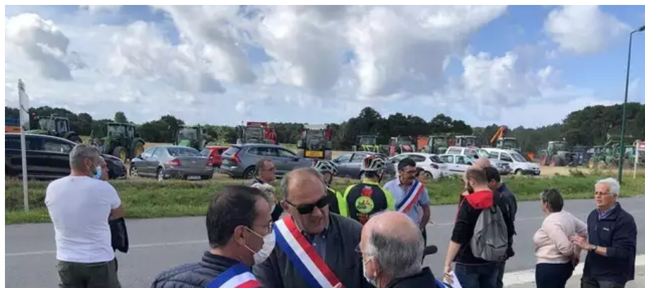
Les élus portent les écharpes. Sont là les maires de Locmiquélic, Nostang, Riantec, des élus de Merlevenez, Plouhinec, ect.