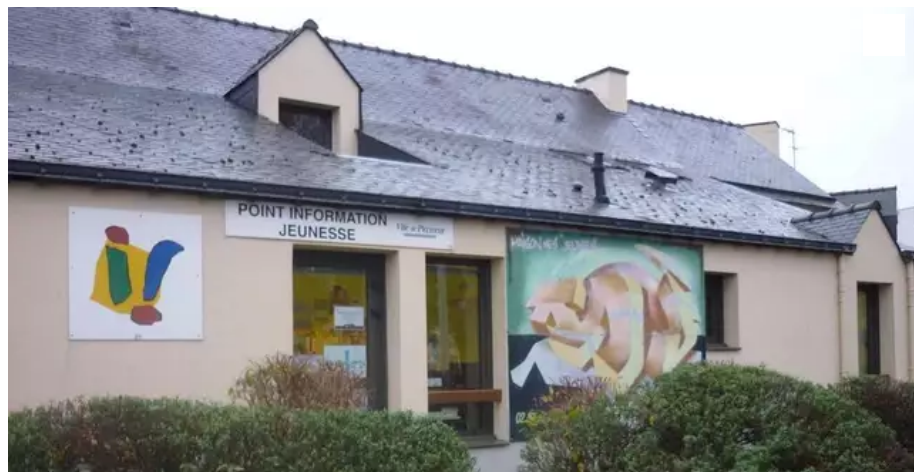
La Maison des jeunes de Ploemeur accueille les 14-17 ans, ainsi que le Point information jeunesse.

La Maison des jeunes, qui accueille les 14-17 ans à Ploemeur (Morbihan), est fermée depuis le 26 juillet 2021, en raison de cas de Covid-19 parmi les animateurs. Les familles ont été prévenues.