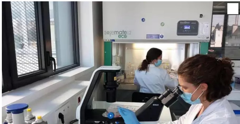
Ose immunotherapeutics espérait une commercialisation de son vaccin efficace contre les variations du virus en 2022. ? © DR

La société nantaise Ose Immunotherapeutics a décidé d'interrompre provisoirement ses essais de phase 1 de son vaccin contre le Covid, en raison « d'un nombre limité d'effets indésirables »