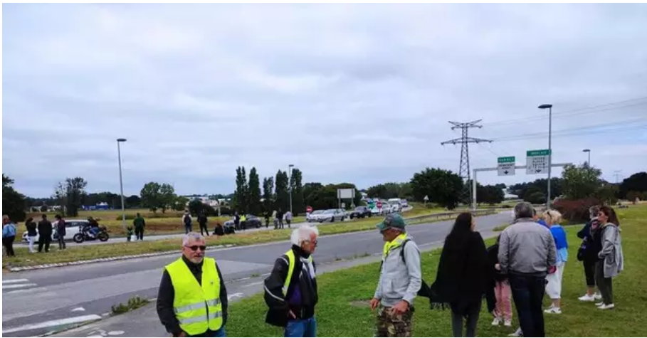
Le rond-point de Lann-Sevelin avait déjà été le lieu de mobilisation des Gilets jaunes.

Toutes deux, comme beaucoup de manifestants présents sur le rond-point, veulent pouvoir se décider elles-mêmes, dans le respect des autres. Parmi les personnes rassemblées ce mercredi, le refus du passeport vaccinal fait l'unanimité.