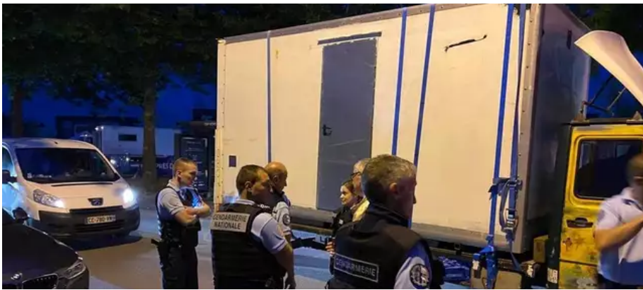
Des camions de sonorisation ont convergé vers Redon, les forces de l'ordre étaient sur place.

Vers 22 h, ils étaient plusieurs centaines de véhicules sur le parking de l'Intermarché, dans la zone Cap Nord de Redon. Des allers et retours entre le parking et la zone commerciale sont organisés à grand renfort de klaxon. « C'est le jeu, on fait toujours ça pour faire monter le truc », lâche un jeune fêtard. Les gérants du supermarché s'inquiètent et attendent de pouvoir rejoindre le magasin.