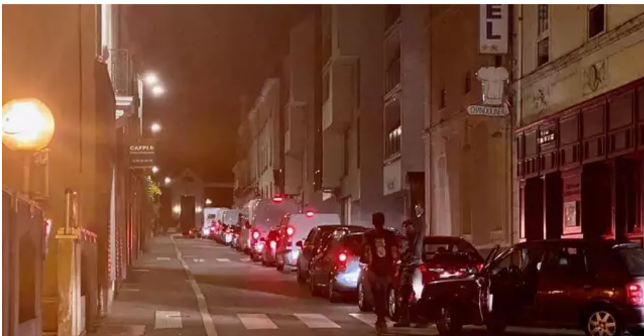
L'ouest du centre-ville a été paralysé une partie de la nuit.

Il fait état de quatre blessés au sein des gendarmes. « Il a eu des jets de cocktails Molotov. Une boule de pétanque a aussi été retrouvée », détaille Jacques Ranchère. De l'autre côté, les gendarmes ont usé de la lacrymo. Les secours ont été mobilisés. Les affrontements ont duré une bonne partie de la nuit.