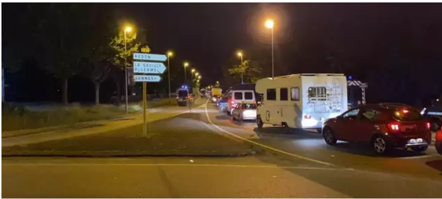
Peu après 23 h, des centaines de voitures et de camping-car se sont dirigées vers le centre-ville de Redon. Les gendarmes mobiles arrivent en renfort et les contournent.